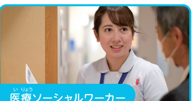
医療ソーシャルワーカー