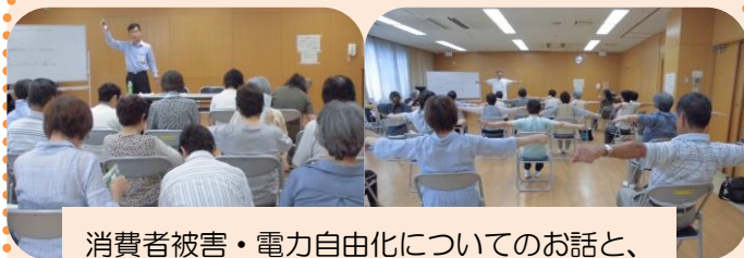
消費者被害・電力自由化についてのお話と、 介護予防・認知症予防の体操を行いました。