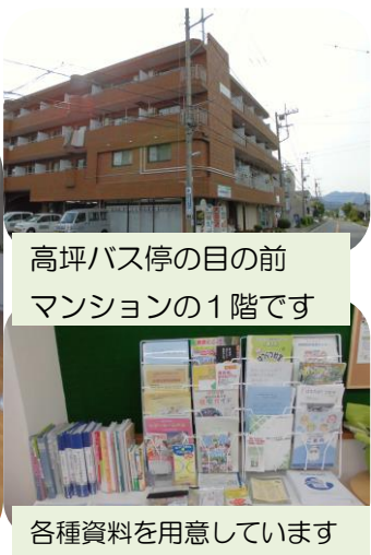
高坪バス停の目の前 マンションの1階です