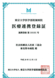
東京大学医学部附属病院と医療連携をしています。

東京大学医学部附属病院放射線治療部門と専門のネットワーク回線を結び、放射線治療計画装置や治療情報などを共有し連携を取ること、厚木市にいながら大病院と同じ精度の治療が受けられる体制を整えています