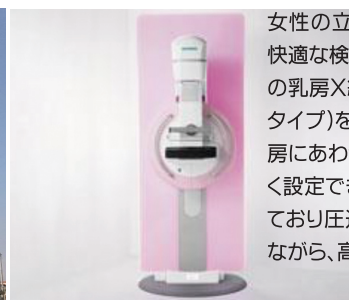
マンモグラフィー撮影室

女性の立場に立ち、最小の被ばくで快適な検査を実現した世界最高水準の乳房X線撮影装置(フラットパネルタイプ)を導入致しました。個々の乳房にあわせて最適な圧迫圧力を細かく設定できる「最適圧迫機能」を有しており圧迫時の痛みを最小限に抑えながら、高画質で病変を描出します。