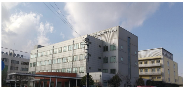
とうめい厚木クリニック(全景)

んは内視鏡的治療が可能なものもあり、大腸がん検診の精検で行なった内視鏡検査で、将来のガンになる可能性のある腺種性ポリープを芽のうちに摘除される方も多いです。コロナ禍の影響もあり、ここ2年程受診率は低下して、進行癌で発見される方も散見されます。スマホやパソコンからオンライン予約でがん検診予約が出来るように準備中です。予約方法につきましては、改めてホームページや院内掲示等でご案内していきます。